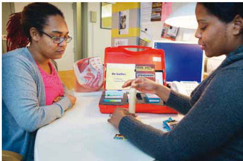
Figuur 2 De anticonceptiekoffer