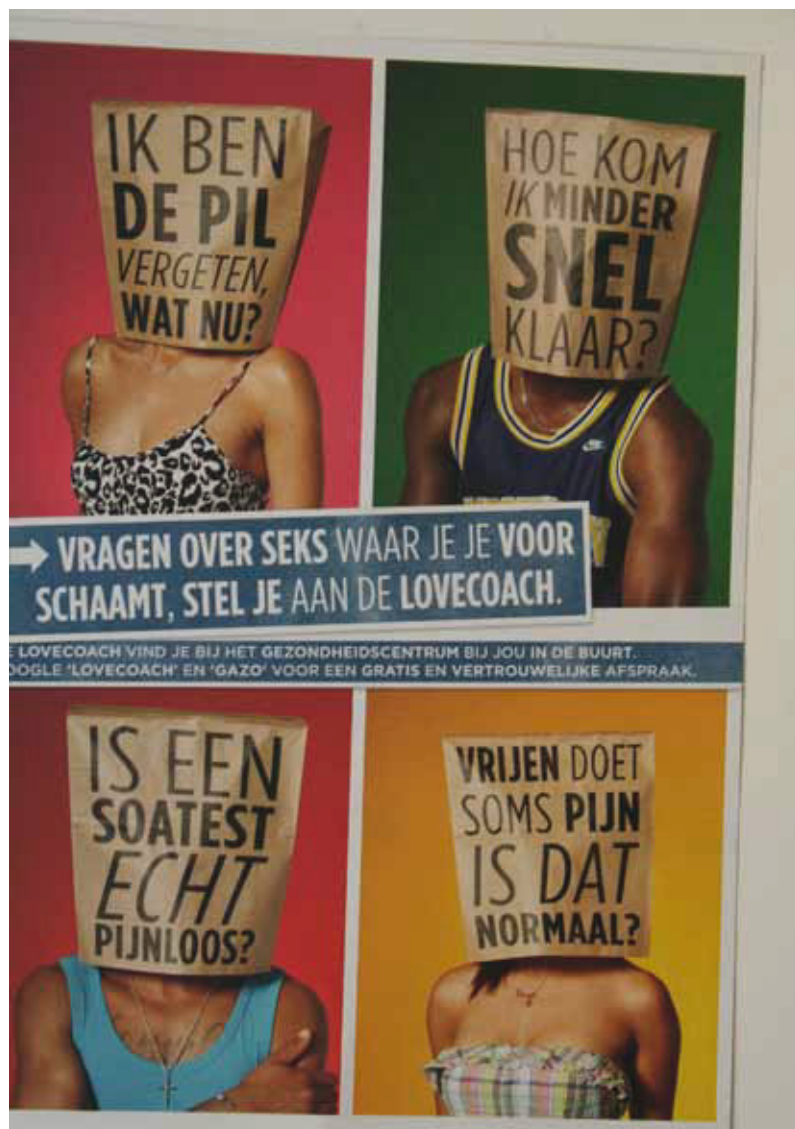
Figuur 3 Voorbeeld van poster tijdens de Lovecoach-campagne

Daarnaast is deze opzet vooral interessant voor grotere samenwerkingsverbanden van huisartsen, zoals gezondheids-